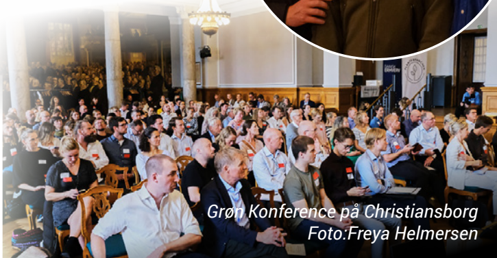
Grøn Konference på Christiansborg